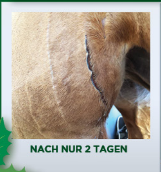
NACH NUR 2 TAGEN