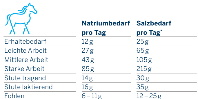
Tabelle 5: Der Natriumbedarf des Pferdes und der Salzbedarf bei üblichen Rationen

Es kommt vor, dass jüngere, unerfahrene Pferde bei entsprechendem Angebot zuviel Natrium über Lecksteine aufnehmen. Dies führt zu erhöhten Wasseraufnahmen, verstärktem Harnfluss, Durchfall und in extremen Fällen zu nervösen Störungen.