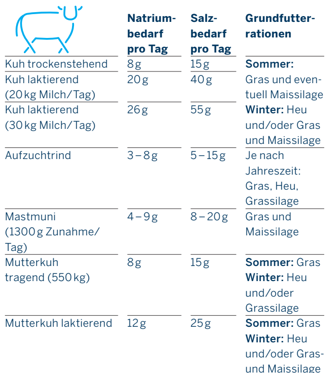
Tabelle 2: Der Natriumbedarf des Rindes und der Salzbedarf bei üblichen Rationen

Bei der Milchkuh gilt es zu beachten, dass es bei einem Natriummangel relativ lange dauert, bis sichtbare Mangelsymptome auftreten. Dies kann zu einer falschen Einschätzung der Versorgungslage führen.